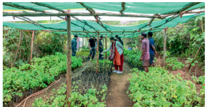
Besichtigung einer Gärtnerei