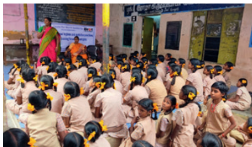
Vasuki klärt Mädchen auf in Sachen Hygiene und Sexualität