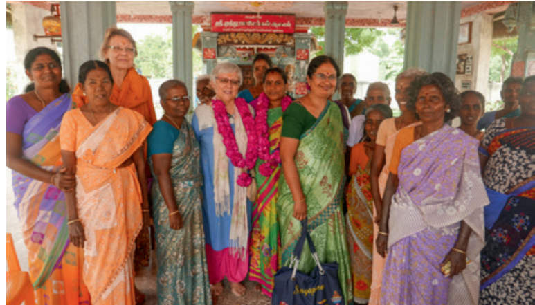
Frauenversammlung mit Vertreterinnen von Dignity