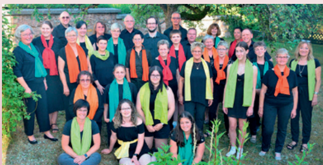
ChorBunt, e Chorale aus dem Saarland

20. 02., 15 Auer: Votum Solemne 01.03., 15 Auer: Weltgebiedsdag zu Klierf, Infoen s. 7-9 20.04.–05.05.: Muttergottesoktav 22.04., 14.30 Auer: Oktavmass vum ACFL a KMA 29.04., 20 Auer: Rousekranz vum der Kommissioun Fra an der Kierch 05.05., 15 Auer: Schlusspressessioun 29.06., 17 Auer: Concert mat der Chorale „ChorBunt“, weider Infoen an der Ausgab 02-2024