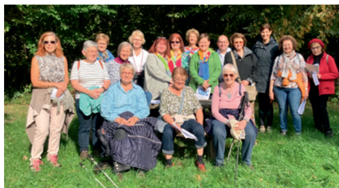
Ein paar Eindrücke von unserem Weg, dem „Mamer Trèppelwee“ ...

Wir ChristInnen können den Zusammenhang von Hoffnung und Handeln mehrdimensional sehen. Denn hoffen darf nur jemand, der sich auch dafür einsetzt, dass das Erhoffte eintritt. So wie beten und handeln – Kontempla-