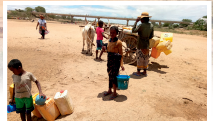
Auf der Suche nach Wasser

„Mat Ärer Hëllef Pëtze fir Madagaskar bauen!“